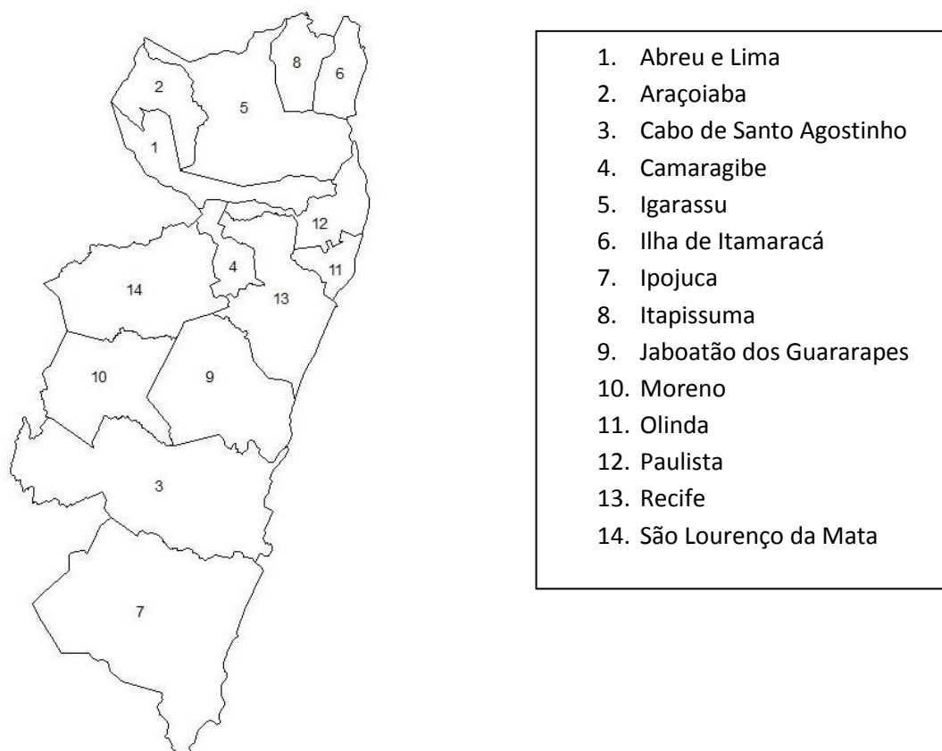
Fig. 1: Mapa da Região Metropolitana do Recife

A Região Metropolitana do Recife é composta por 14 cidades que circundam a capital do estado de Pernambuco, Recife. O estado, situado no nordeste do país, tem sua capital localizada no litoral, assim como a maioria das cidades que compõem a RMR, como mostra a figura 1.